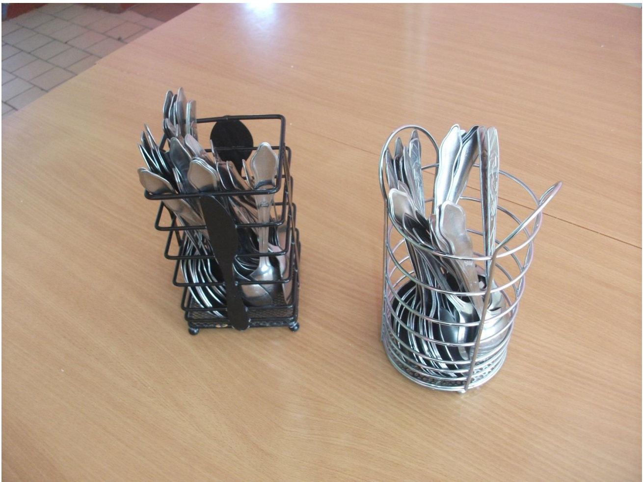
Ложки после прокаливания