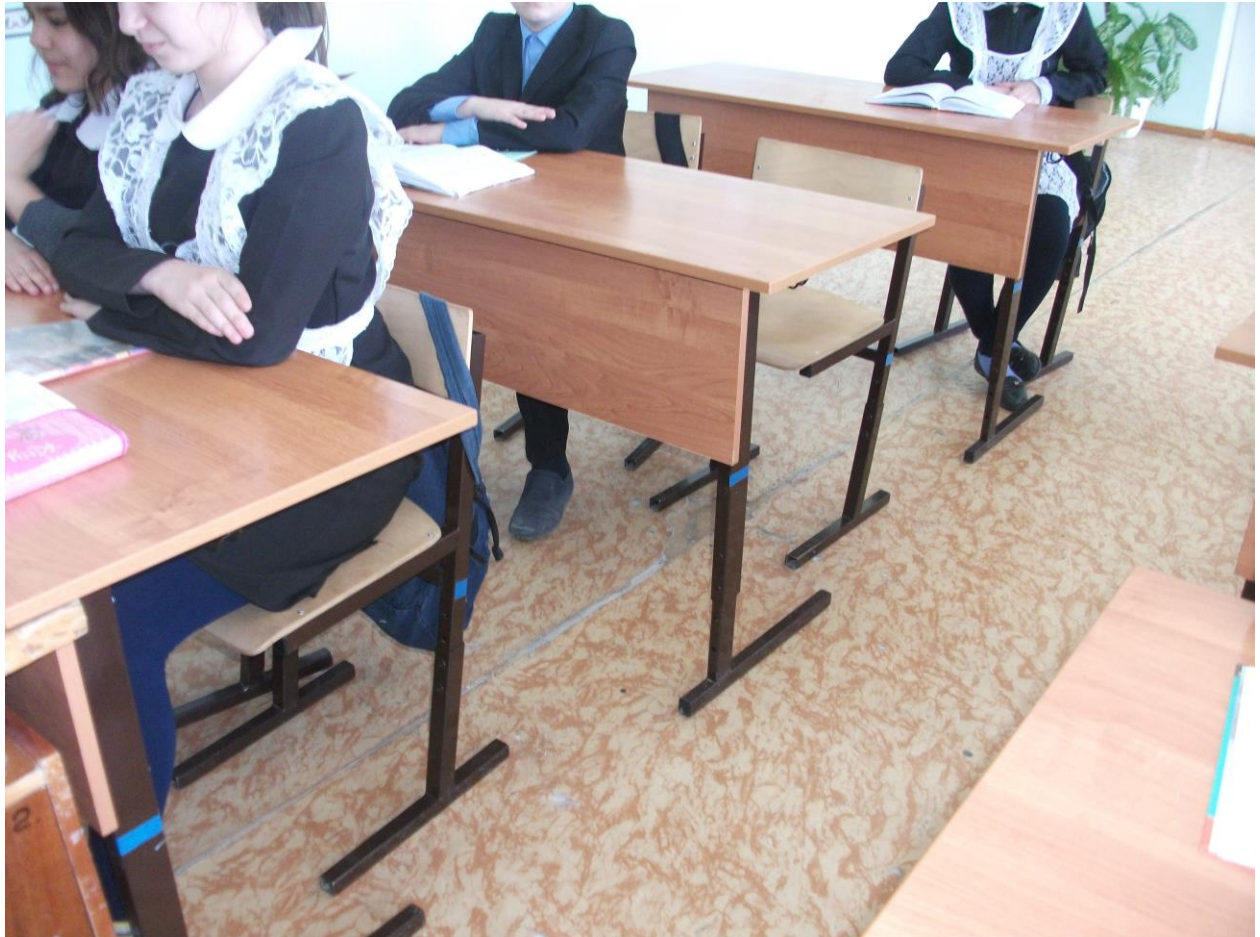
Кабинет русского языка