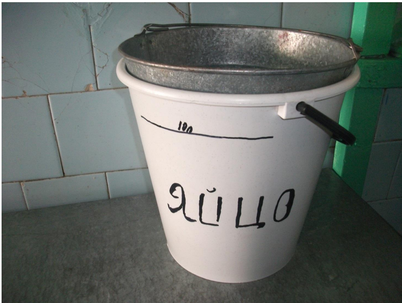
Ёмкость для обработки яиц